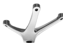
SPIDER GIREVOLE SENZA COMANDO GAS CODICE: 1050540