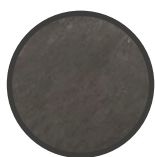
SUPPORTO IN METALLO NERO