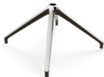
BASE UNICA 4 RAZZE CODICE: 5010430