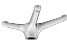
SUPERLEGGERO GIREVOLE SENZA COMANDO GAS CODICE: 1050610