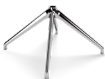
BASE SUPERLEGGERA 4 RAZZE — ALTA CODICE: 5010480