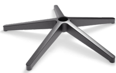
DB1.13 - Ø 737 mm (NYLON) CODICE: 5012080