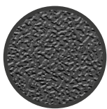
FOTOINCISIONE (NOVATEX 340)