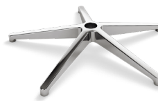
DB1.13 XL - Ø 737 mm (ALUMINIO) CODICE: 5010870